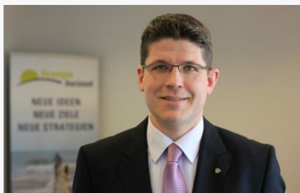
Wünsche oder Hinweise? - Schreiben Sie mir! robert.fischer[at]strategiehorizont.de

Ihre Fragen zur QM-Optimierung der von Ihnen genutzten Örtlichkeiten beantworten wir gerne unter 030 - 9441 3934 .